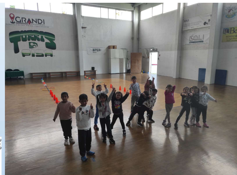
Scuola attiva kids